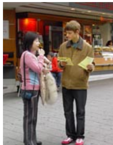
Besonders eindrucksvoll war die Zusammenarbeit der 1. und 2. Generation