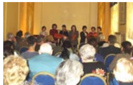
Die japanischen Schwestern singen ein Lied nach dem Vortrag

Leider bekam ich von der Hauptveranstaltung nicht so viel mit, da ich als Security eingeteilt war, aber beim HDH zeigten sich die WE entspannt und freuten sich über die Aktivitäten ihres Enkels, der oft in den Mittelpunkt der Aufmerksamkeit geriet. Die Zusammenarbeit mit Geschwistern aus Polen, Tschechien, Frankreich, Japan, Deutschland etc. - ist ja eigentlich egal, wo man herkommt - war ein besonderes Phänomen, da wir auch altersmäßig (14-68 Jahre) ganz kurzfristig zusammengewürfelt worden waren. Wir arbeiteten einfach als eine Familie und dies ist für mich nach dieser Erfahrung die eigentliche Bedeutung des Weltfriedens.