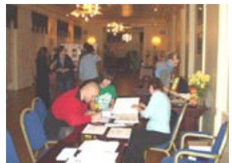
Photoausstellung: ein Gast wird FB und registriert sich für die Veranstaltung

Die Resonanz der Leute war sehr gut und bald wurde die 120er Marke bei den Besucherzahlen durchbrochen und gegen Ende der Ausstellung waren es sogar über 240 Besucher, die an einem Tag die Ausstellung besucht hatten. Die Lage der Exhibition, wie wir sie nannten, war denkbar günstig. Sie befand sich