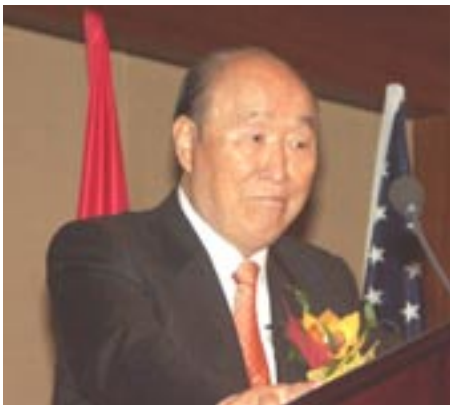
Vater Moon bei seiner Ansprache im Hotel Westin Warschau