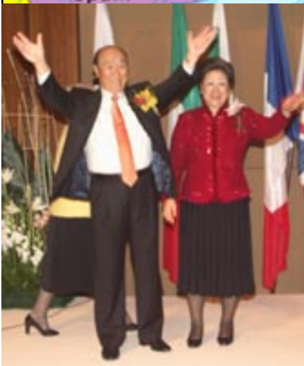
Die Wahren Eltern nach der Ansprache im Westin Hotel, Warschau, 24. Okt.