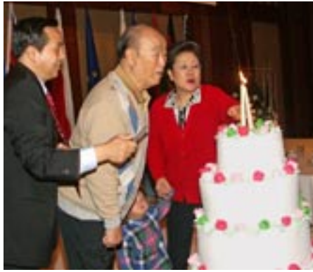
Die Siegestorte wiegt 75 kg!